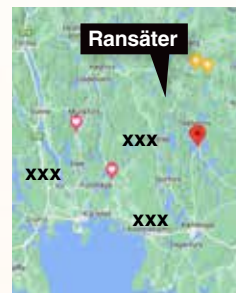
Augusta flyttade från Grythyttan till Åsens gård i Ransäter, Värmland.

att ombesörja skjuts mellan gästgivargårdarna i Grythyttan och Loka brunn för kurortens gäster. Den som ägde den snabbaste hästen och finaste åkdonet fick de bästa kunderna.