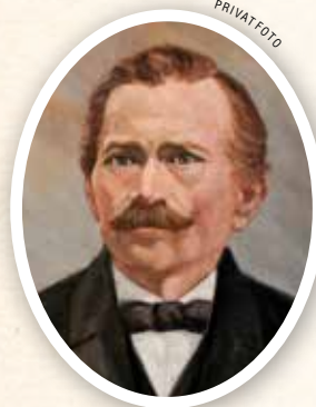
Leonard Andersson (1847–1914) på ett porträtt av konstnären Gund Loman 1911. Nästa generation tog efternamnet Lennartson efter fadern Leonard.